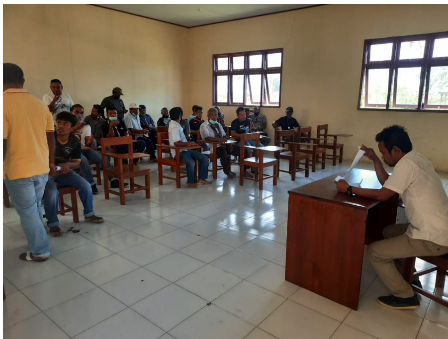
Gambar 2. Sosialisasi Standar Tarif Angkutan Umum