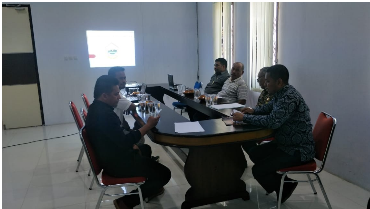
Gambar 1. Pelaksanaan Presentase Hasil Analisis dengan Mitra

Pelaksanaan presentase yang dilakukan dengan pihak Mitra dalam hal ini ORGANDA Kabupaten Pulau Morotai bersama Dinas Perhubungan Kabupaten Pulau Morotai berjalan dengan baik. Kegiatan presentase ini dengan maksud memberikan pandangan dan komparasikan data analisis yang telah dilakukan. Berikut dokumentasi pelaksanaan presentase Tim Pengabdian dengan Mitra dan Dinas terkait seperti pada Gambar 1 berikut.