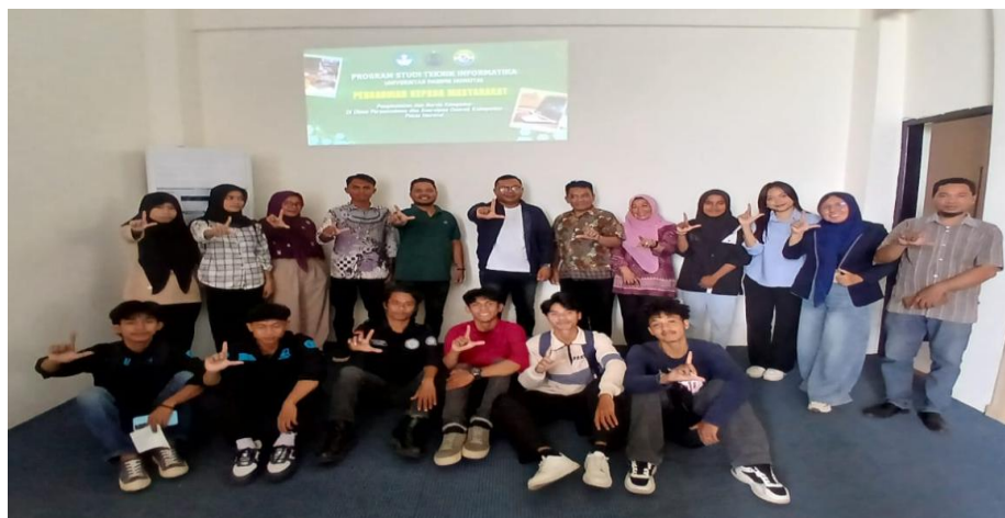
Gambar 2. Tim Pelaksana Pengabdian Bersama Pihak Dinas Perpustakaan.