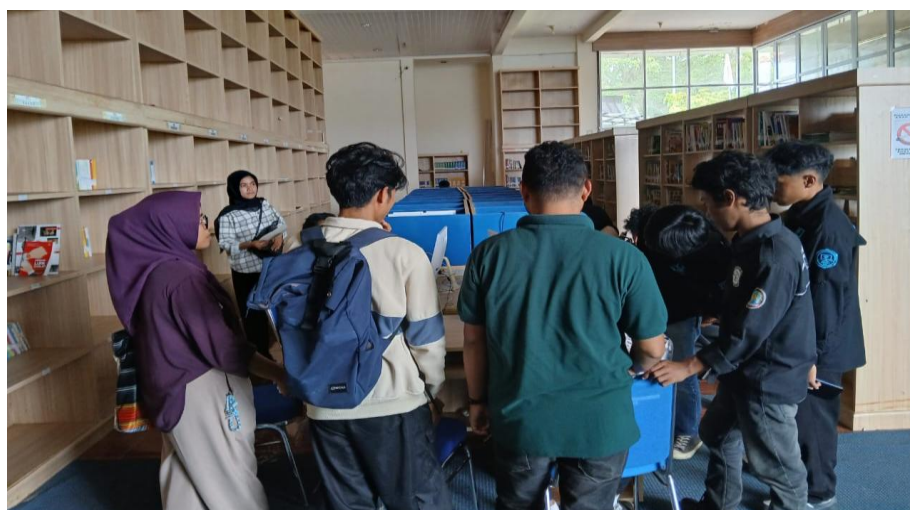
Gambar 3. Penyampaian Kebutuhan Terkait Instalasi Windows