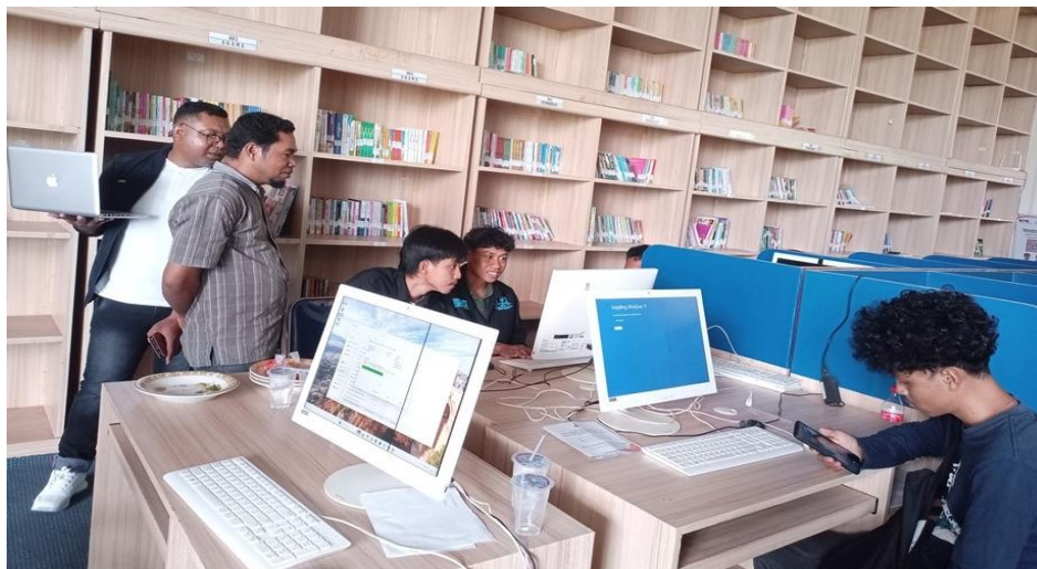
Gambar 5. Proses Instalasi Windows dan Aplikasi Pendukung Lainnya.