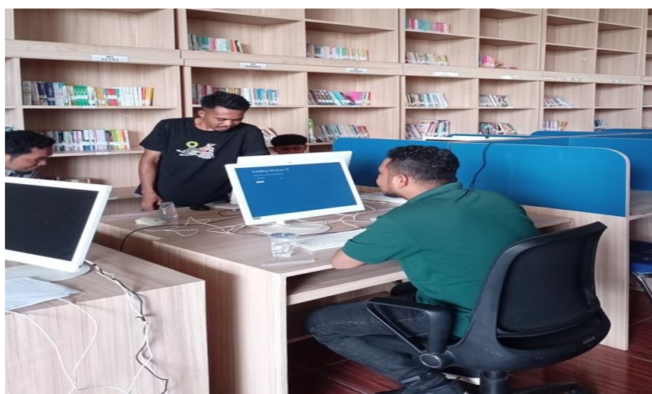
Gambar 4. Proses Instalasi Windows dan Aplikasi Pendukung Lainnya.