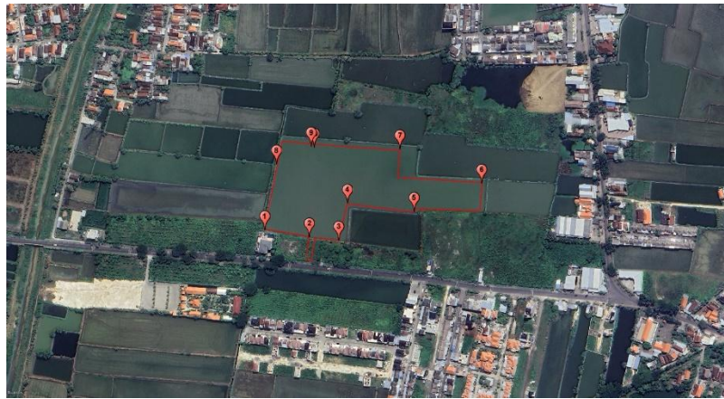
Gambar 1. Peta Lokasi Penelitian