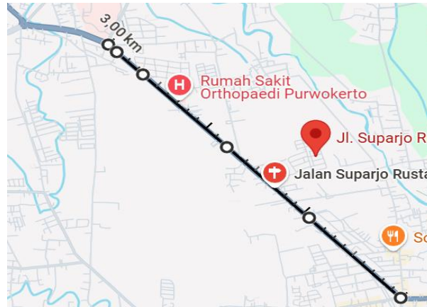
Gambar 2 Ruas jalan dengan tipe 4/2TT