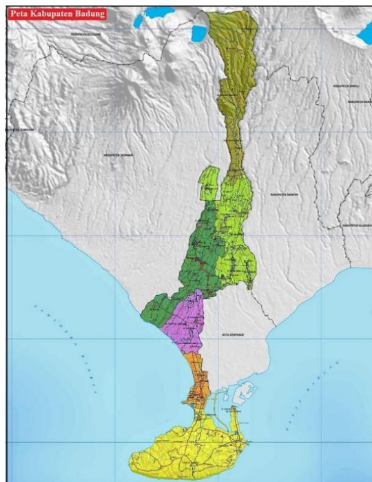
Gambar 1. Peta Wilayah Kabupaten Badung

Penelitian ini bertujuan untuk menganalisis distribusi curah hujan di Sub DAS Badung menggunakan metode Log Pearson III. Data curah hujan diperoleh dari beberapa stasiun pengamatan dalam periode tertentu dan dianalisis untuk menentukan distribusi probabilitas yang paling sesuai. Hasil dari penelitian ini diharapkan dapat memberikan informasi yang bermanfaat dalam perencanaan pengelolaan sumber daya air serta sebagai acuan dalam penyusunan strategi mitigasi banjir di Sub DAS Badung.