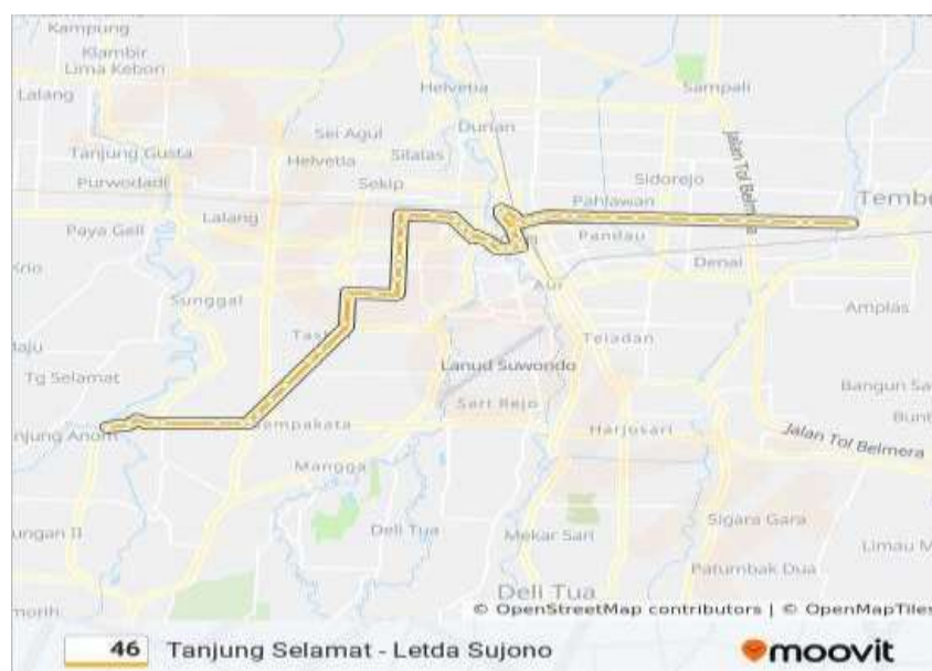
Gambar 1 Lokasi penelitian ( Google map, 2024)

Lokasi penelitian dari Kota Medan sebagai wilayah studi yang terdiri dari kecamatan Medan Perjuangan yang di tunjukan pada Gambar 1.