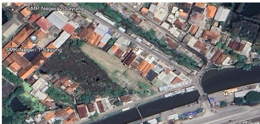
Gambar 1. Lokasi tempat pengambilan sampel tanah di Daleman, Loireng, Kec. Sayung, Kabupaten Demak.

lokasi pengambilan sampel tanah untuk penelitian terletak di Daleman, Loireng, Kec. Sayung. Dengan kedalaman 0.00 – 3.00 m untuk tanah lempung.